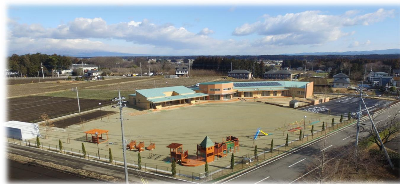
【金丸こども園全景】

これらの取り組みに積極的に取り組むことにより、地域の皆さまに愛され、親しまれる施設になるよう精一杯努力してまいりますので、ご理解とご協力を賜りますようお願い申し上げます。